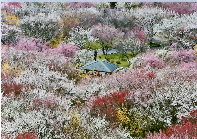
伊勢神宮の鳥居からの日の出(上)

内宮手前にある宇治橋の鳥居の背景から昇る朝日は美しさと神々しさを兼ね備え、橋の造形と相俟って参拝者の心に強く印象づける。鳥居の高さは約7.44m、最も太い部分の直径は約70cm、総重量は約5トンである。